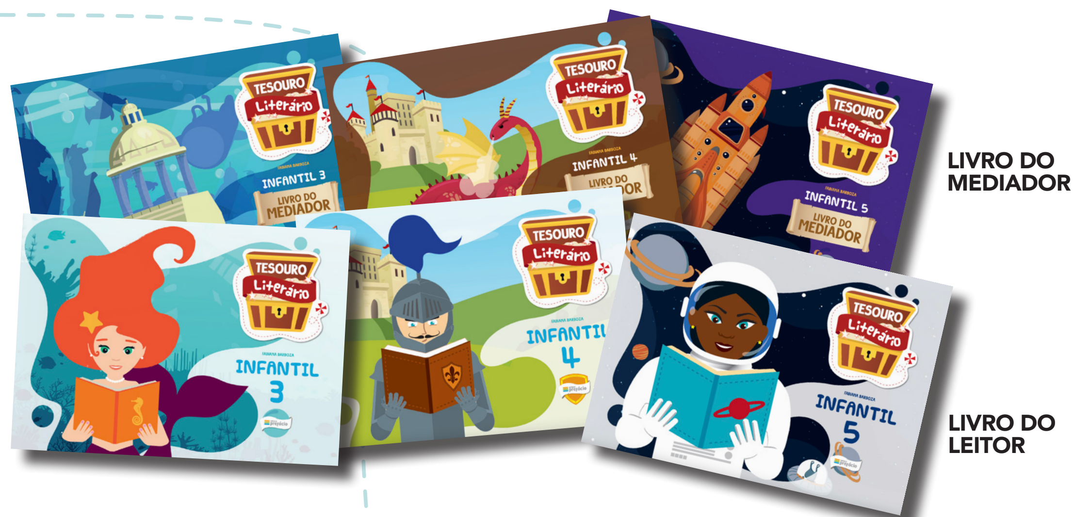
LIVRO DO MEDIADOR